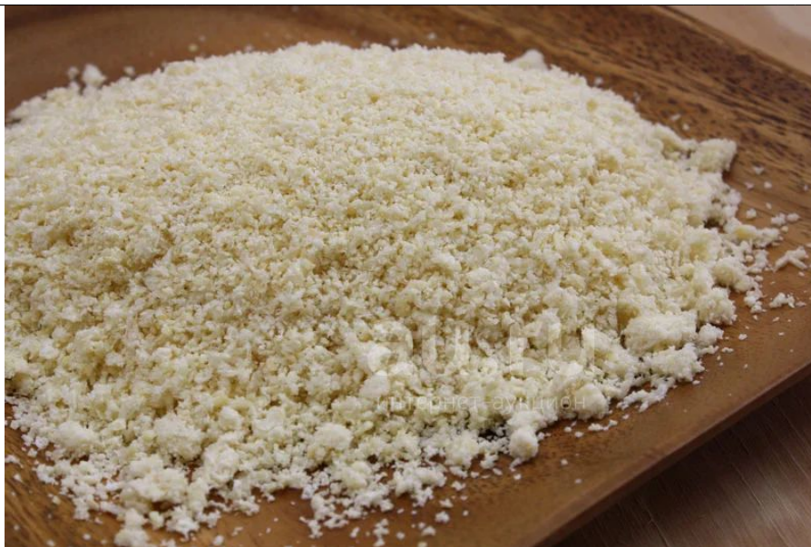
Рисунок 1 – Соевая окара

Цель работы – решение научно-практических задач по разработке рыбных изделий с добавлением соевой окары для систематического употребления, с целью повышения биологической ценности рыбных продуктов.