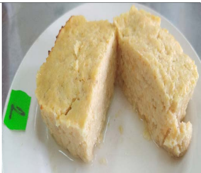
Рисунок 2 – Образец №1 (рыбный паштет без добавления соевой окары)