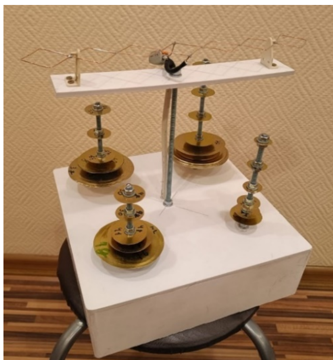
Рисунок 2 – Многолучевой распространитель сигнала «Зонт»

Так как у усилителя сигнала «WIFI gun» радиус распространения волны является точечно (15 градусов), то родилась идея создать новое устройство по распространению сигнала на 360 градусов «Зонт».